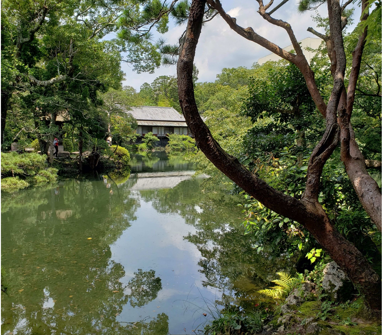
『水湧けば 人も沸くなり 小浜池』

8月に子供と楽寿園に行きました。 夏期間は水遊びができる場所があるので、毎年なんだかんだ足を運んでいるのですが、今年はずっと水がない小浜池に水があると耳にしたので、子供以上に張り切って行きました。小浜池が満水になったのは約9年ぶりだそうで、いつも以上に人がいたように感じました。自分も小浜池に水があるのを初めて見たので、記念に上記の写真を撮りました。インターネットで探せば湧水時、満水時の写真が見つかりますので、気になる方は検索してみてください。