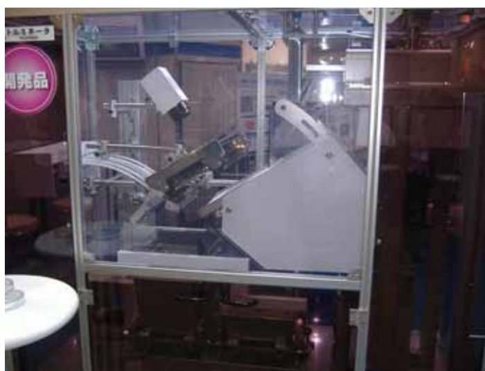
開発中の異色物検出除去装置「トルミネータ」 医薬業界を中心に問い合わせが殺到しています。