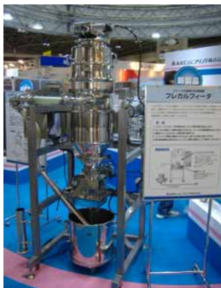
複数機能を融合した「かるがるコンベア」