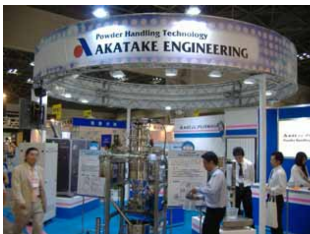
今回は、3つの新製品を中心に展示致しました。