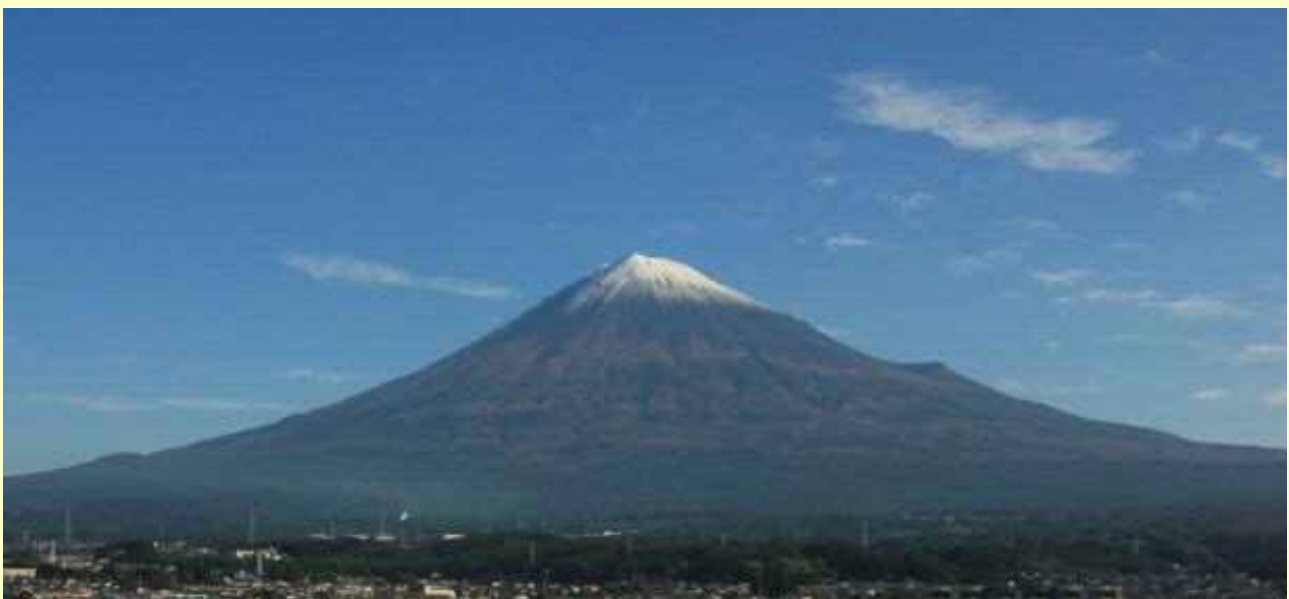
今年の初冠雪後の富士山です